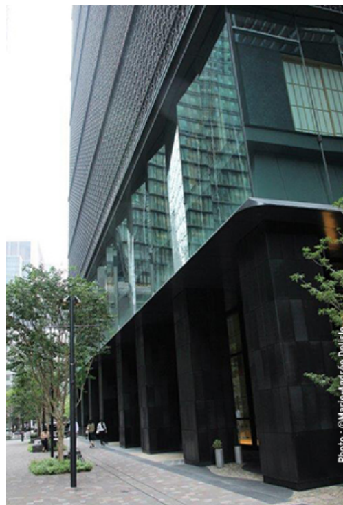
Hoshinoya Hotel sur rue piétonne