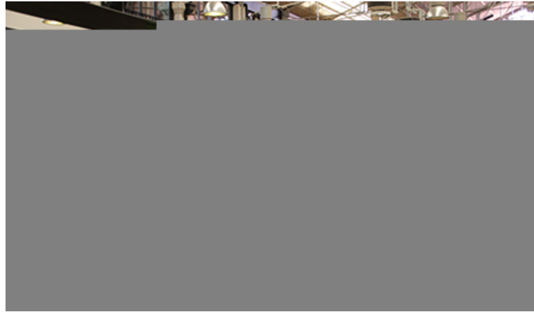
Le Mercado da Ribeira.