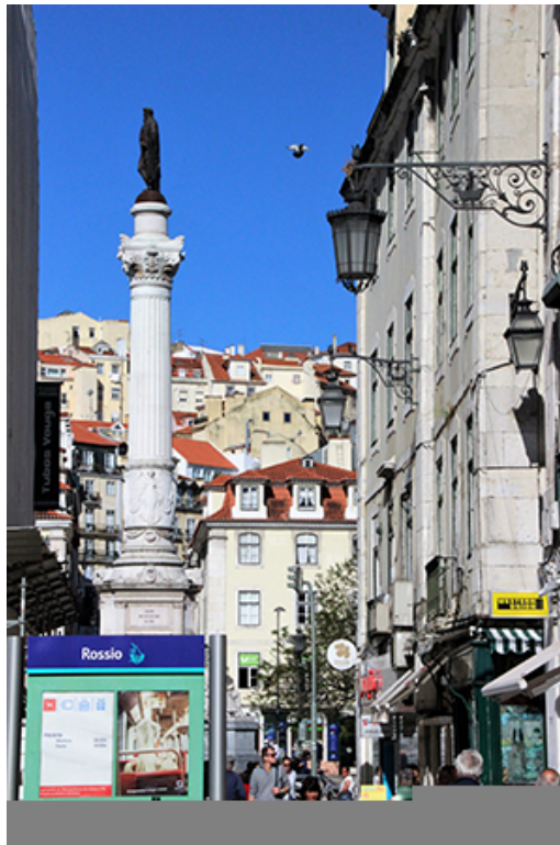
Le très animé quartier de Rossio en basse ville.