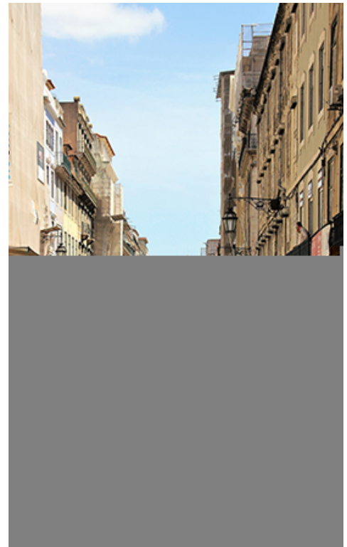
Les pavés de calcaire et de basalte.

Plutôt que de visiter musées, églises et châteaux, j'ai opté pour la découverte de La Mouraria . Situé au pied du Castelo de São Jorge, cet ancien quartier mauresque a vu naître le fado , cartier replica cette musique mélancolique typiquement portugaise. On le disait malfamé, car c'était un quartier de prostitution – le chant du fado servait à rameuter les clients!