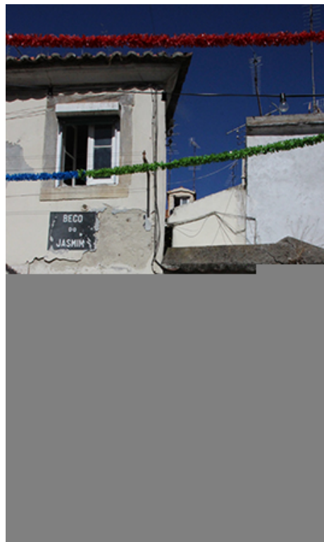
Photographie murale de Fernando Maurício à Mouraria.

Les ruelles tortueuses de La Mouraria offrent des portraits exceptionnels des grands chanteurs pionniers du fado . Une artiste britannique a trouvé moyen d'imprimer de vieilles photographies sur les murs, leur donnant un aspect culturel inédit. Le quartier est moins touristique, plus poétique et tranquille que l'Alfama , son voisin, où se trouvent la plupart des bars à fado .