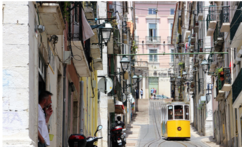
La ville, toute en collines.

L'engouement pour le Portugal est impressionnant. Les liaisons aériennes, le transport en commun, le grand choix d'hébergement et une authentique convivialité y contribuent. Et puis, il y a Lisbonne. Trop court, mon séjour dans la capitale portugaise m'a néanmoins permis d'apprécier le quotidien des Lisboètes.