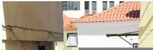
Sinueuses rues de l'Alfama.