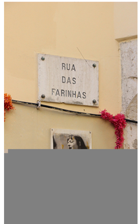
Les photographies de Camilla