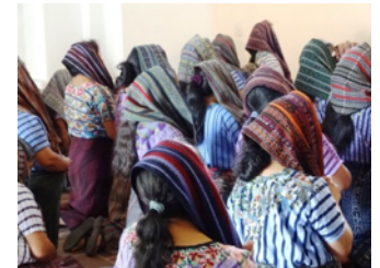
Une prière communautaire pendant laquelle on entend un fervent réciter ses péchés à haute voix parmi le groupe qui s'incline devant un petit autel. L'intensité de la dévotion et de la croyance ne peut faire autrement que de nous émouvoir.