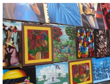
Les artistes de rue, bavards chaleureux, où copies et originales se côtoient !