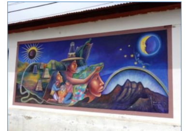
Une murale de San Juan La Laguna dépeignant l'un des 13 Baktun de la culture maya. Une initiative d'artistes locaux dans le cadre des célébrations de la fin du calendrier maya et du début d'un nouveau monde...