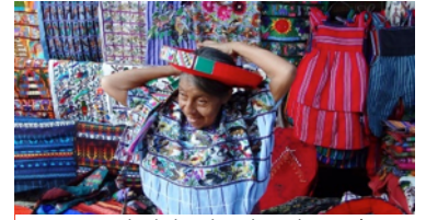
Faut enrrouler le bandeau long de 30 mètres chaque matin! Démo : http://bit.ly/19p5RqP . C'est l'une des activités que la communauté de Santiago a mis sur pied en faisant participer les visiteurs.