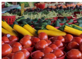
La corde de légumes