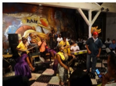
Les jeudis endiablés du groupe RAM à l'Hôtel Oloffson.