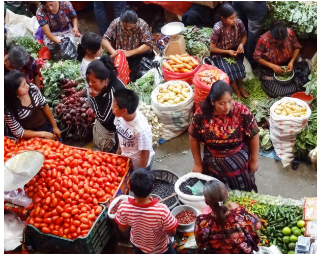
Le marché vu de haut, une scène souvent reprise par les artistes peintres. Cette scène grouillante, éclatée de couleurs vives, est un reflet unique du mode de vie des Guatémaltèques.