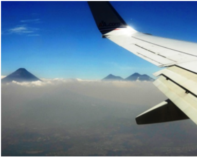
Pas encore débarqués de l'avion, qu'on sait déjà qu'on entre au pays des volcans!