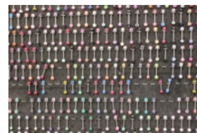
Détails d'une puce ? Non, piercings colorés!

Exercer son œil pour capter le moment ou la situation, ça fait aussi partie de mon travail d'éclaireur et des outils d'analyse que j'applique lors de mes mandats.