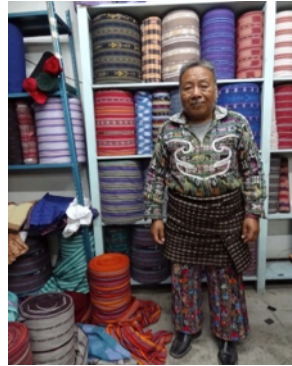
La boutique où j'achète les tissus qui deviendront de jolies nappes! Et que dire de la magnifique tenue quotidienne du magasinier!