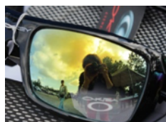
Photographe se photographiant, un 'selfie'