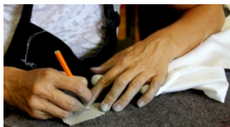
Mains d'artiste à l'oeuvre

La photographie continue d'être une activité qui m'est chère et chaque occasion est bonne pour m'y entraîner. Ci-dessous, quelques résultats de mes essais photographiques lors de l'atelier de photos à l'École d'été de Mont-Laurier. Les sujets à l'étude : architecture, nature, personnages, artistes, photos de nuit, cinq jours à expérimenter des lieux, des lumières, des mouvements, des couleurs et des trucs insolites !