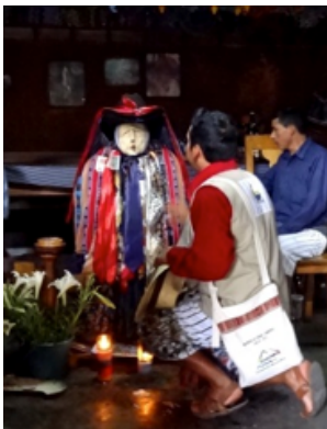
Le fameux Maximón, que l'on fait boire et fumer pour s'attirer de bonnes augures! Le synchrétisme s'arrête ici, car le culte voué à ce saint est fortement ancré dans les croyances maya.