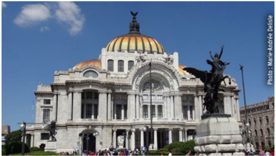
Palacio de Bellas artes.