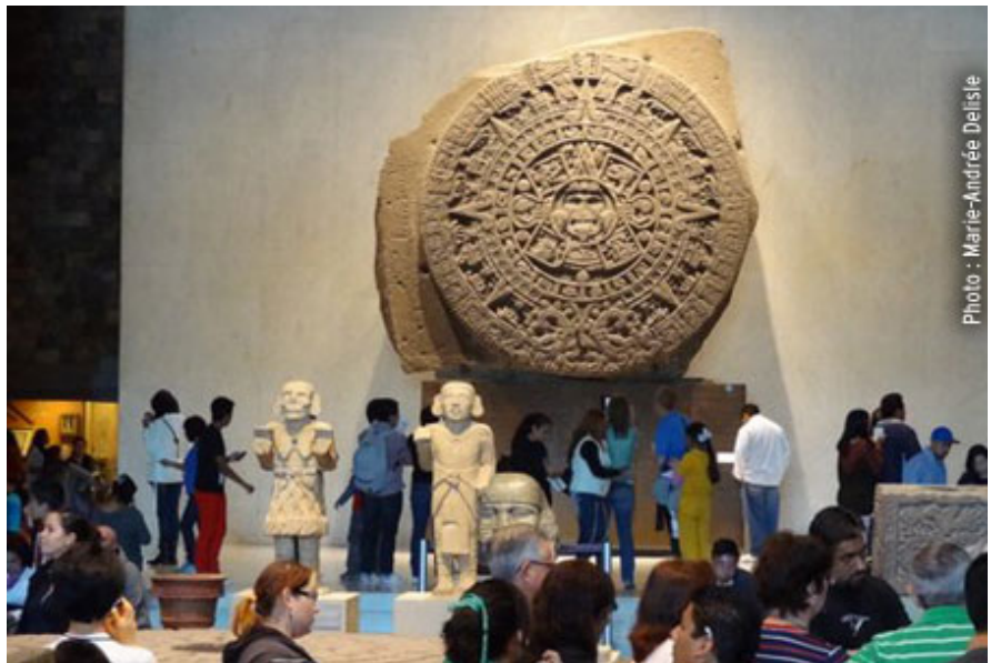
Tlaloc, dieu de l'eau aztèque, au Musée d'anthropologie.