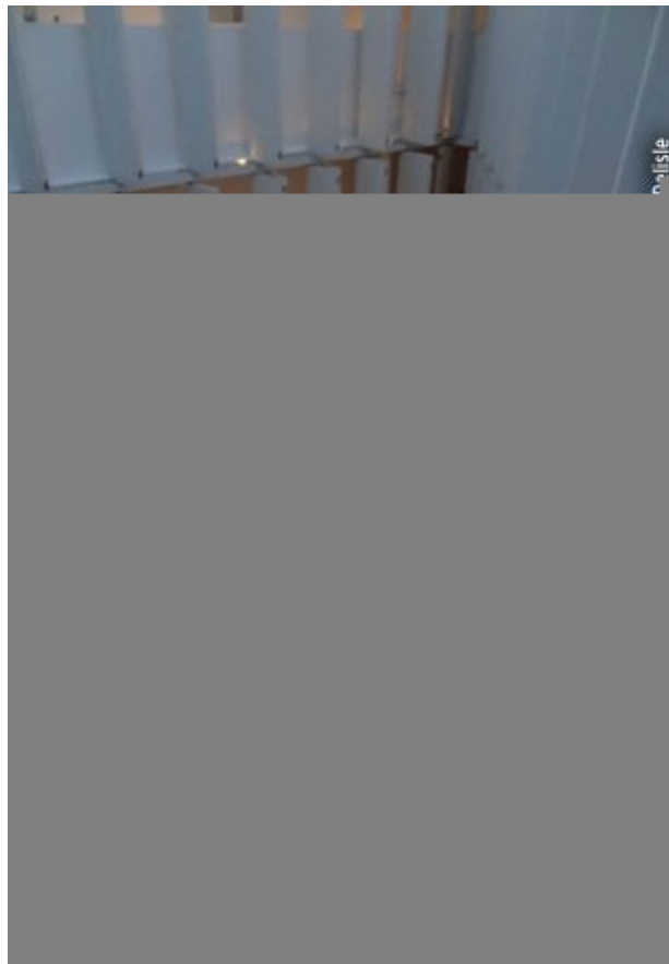
Hôtel Condessa DF.