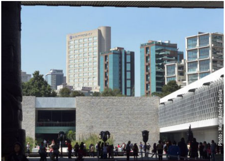
Vue du Hyatt Regency depuis la cour du Musée d'anthropologie.