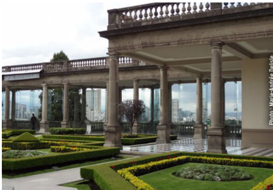
Le Castillo de Chapultepec.