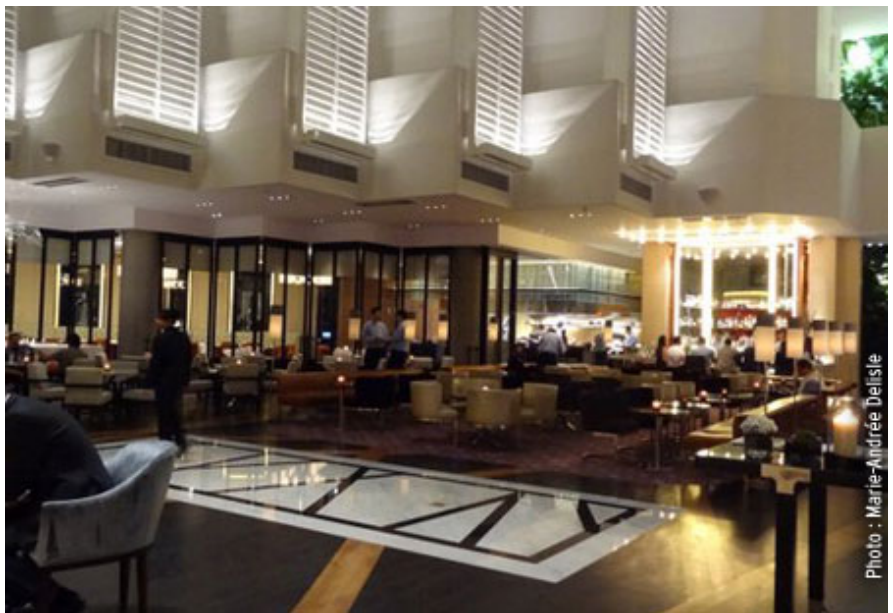
Le hall du Hyatt Regency.