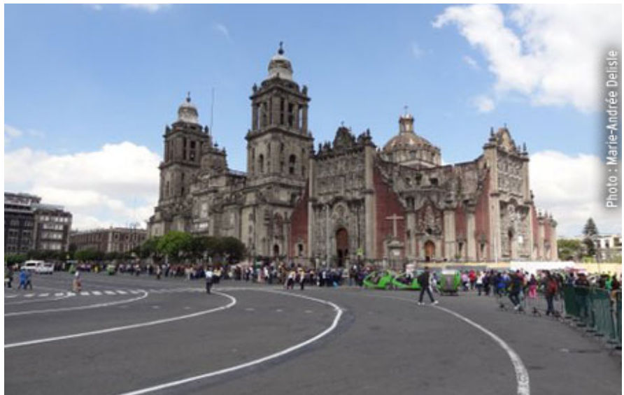
La cathédrale métropolitaine, Place du Zocalo.