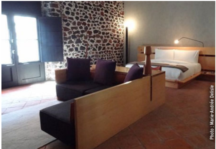
Hôtel DownTown Mexico.