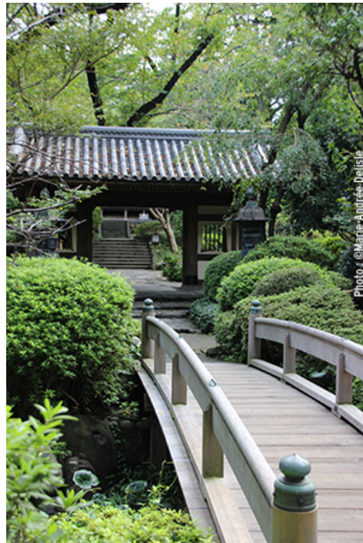
Jardin du Grand Prince New Takanawa Hotel dans le quartier de Shinagawa.