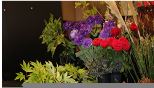
Boutique d'atelier d'Ikebana de l'hôtel