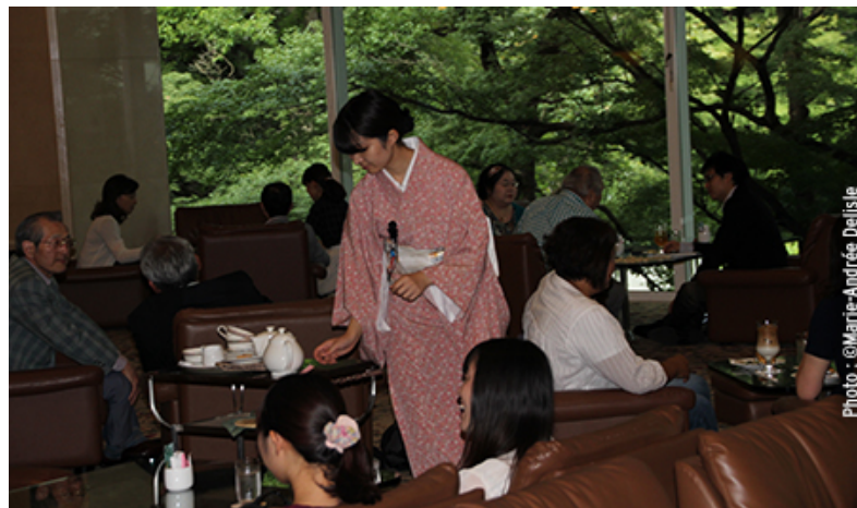
Magnifique mûr de verdure du hall de l'hôtel