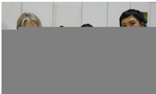
En rencontre avec Satoyama Experience